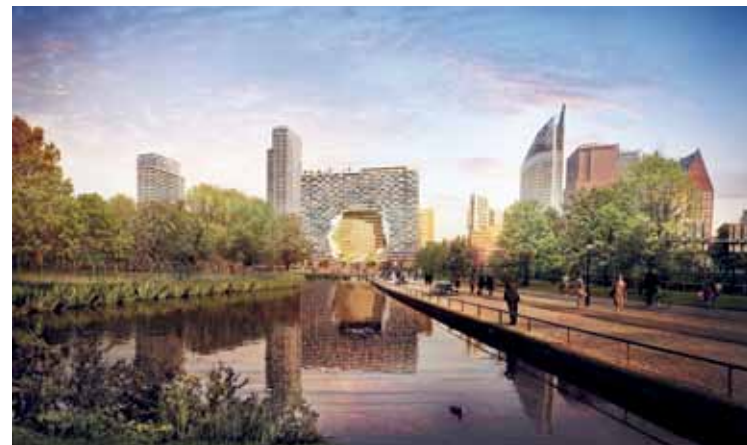
Het opvallende ontwerp van team Provast (met MVRDV en Lola) een