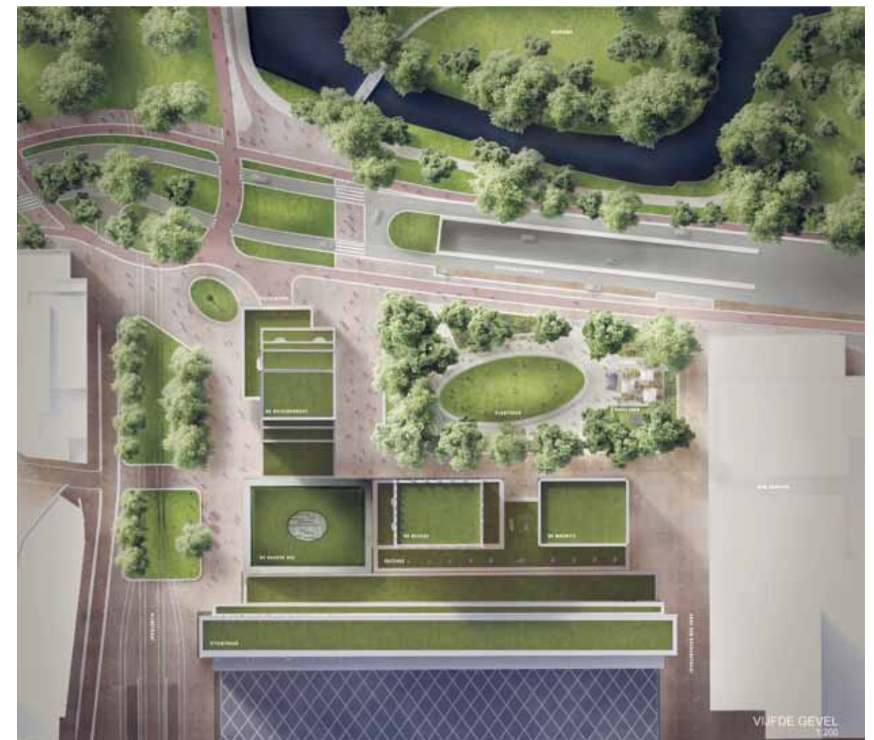
Het nieuwe plein volgens het team van VolkerWessels (met West8 en Queeste Architecten). In het midden