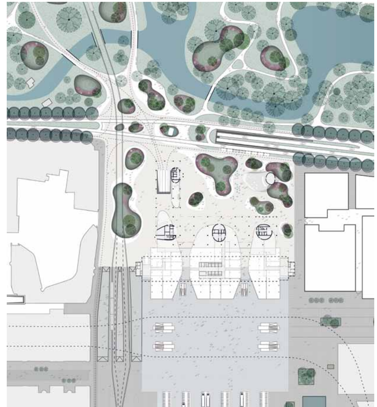
Het pleinontwerp van team Synchroon. De glooiende eilanden met bomen en siergrassen zijn verblijfsplekken en vormen de overgang tussen het station en de noordelijk gelegen Koekamp. Op de tekening is te zien hoe het plein onder de nieuwbouw doorloopt. Het besluit om gebouw en plein uit elkaar te halen kan het pleinontwerp ondermijnen.

gebouw, en van de relatie met de buitenruimte.