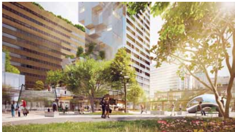
In de zogenoemde KJ-tuin is maar mondjesmaat ruimte voor bomen en gras.