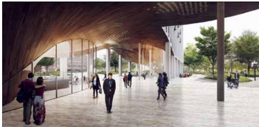
In het plan van Synchroon en Amvest loopt het stationsplein onder het nieuwe gebouw door. Het

golvende houten plafond sluit aan op de inrichting van het plein.