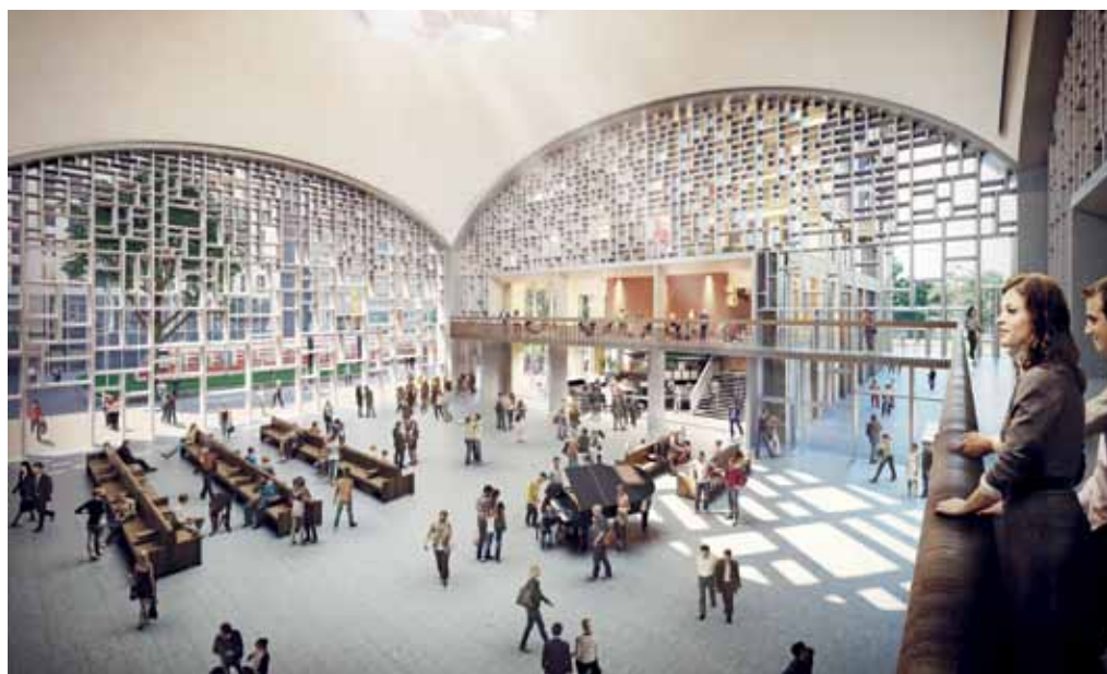
De 'Haagse Hal', een verlangstuk van de stationshal waardoor reizigers naar het plein en de stad kunnen lopen.