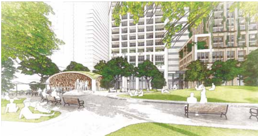
Schets van het toekomstige stationsplein volgens team VolkerWessels, met links een nieuw paviljoen.

oversteken richting de Koekamp en de stad. De glooiende druppels spreiden zich verder over het hele gebied uit. Het idee daarachter is dat zij plaatselijk voor hoogwaardige aankleding van de openbare ruimte zorgen. Of de knip in de Bezuidenhoutseweg haalbaar is moet nog onderzocht worden. De ingreep heeft vergaande gevolgen voor de bestaande routes voor het autoverkeer. De gemeente is nog lang niet overtuigd. Ook van andere elementen in het ontwerp is het afwachten of de gemeente daarin meegaat. Den Haag heeft zich vooraf tot niets verplicht. Maar het feit dat ze deze uitvraag heeft gedaan schept wel verwachtingen. Niet alleen bij de ontwerpers, maar ook bij het publiek.