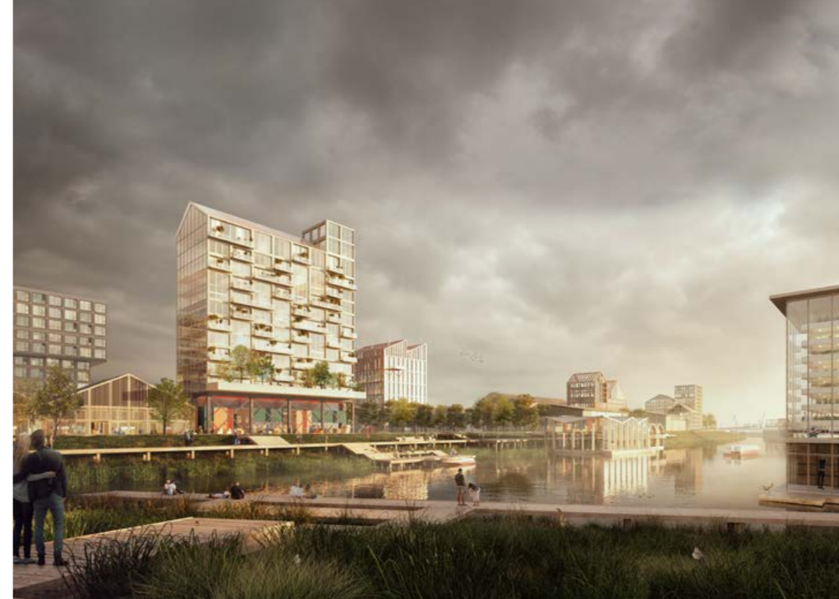
BOVEN IN ROTTERDAM DOET DELVA HET PROJECT 'MERWE VIERHAVENS', DE VERGROENING VAN EEN VAN DE OUDSTE HAVENBEKKENS.

circulaire, het sociale, inclusieve, klimaatadaptieve en het economische. Maar blijkbaar deed het ertoe en dat gaf vleugels.'