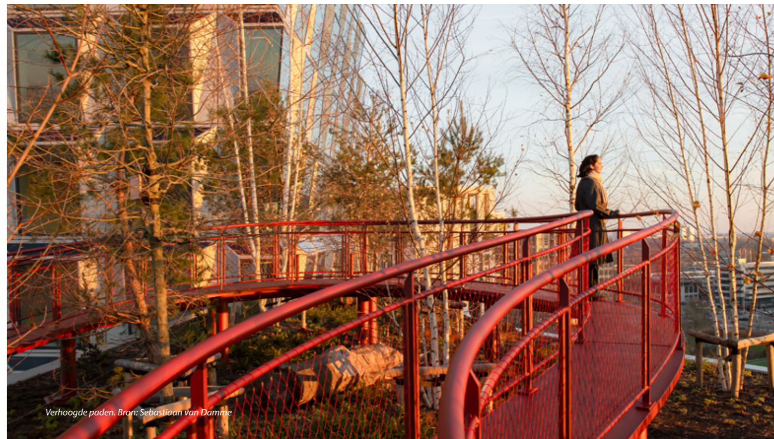
Verhoogde paden.