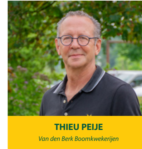
THIEU PIJE Van den Berk Boomkwekerijen

De gemeente stelde als randvoorwaarden dat 30 procent van de plot groen zou worden en het hemelwater zou worden opgevangen