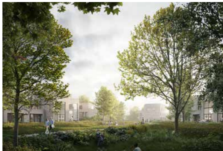
Linksboven: een combinatie van industrieel erfgoed en natuurlijke vernieuwing in Beringen.