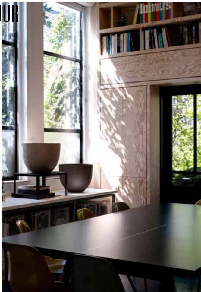
De thuishaven van Delva in Amsterdam werd uitgewerkt tot een groene stadsoase voor wonen, werken en logeren.